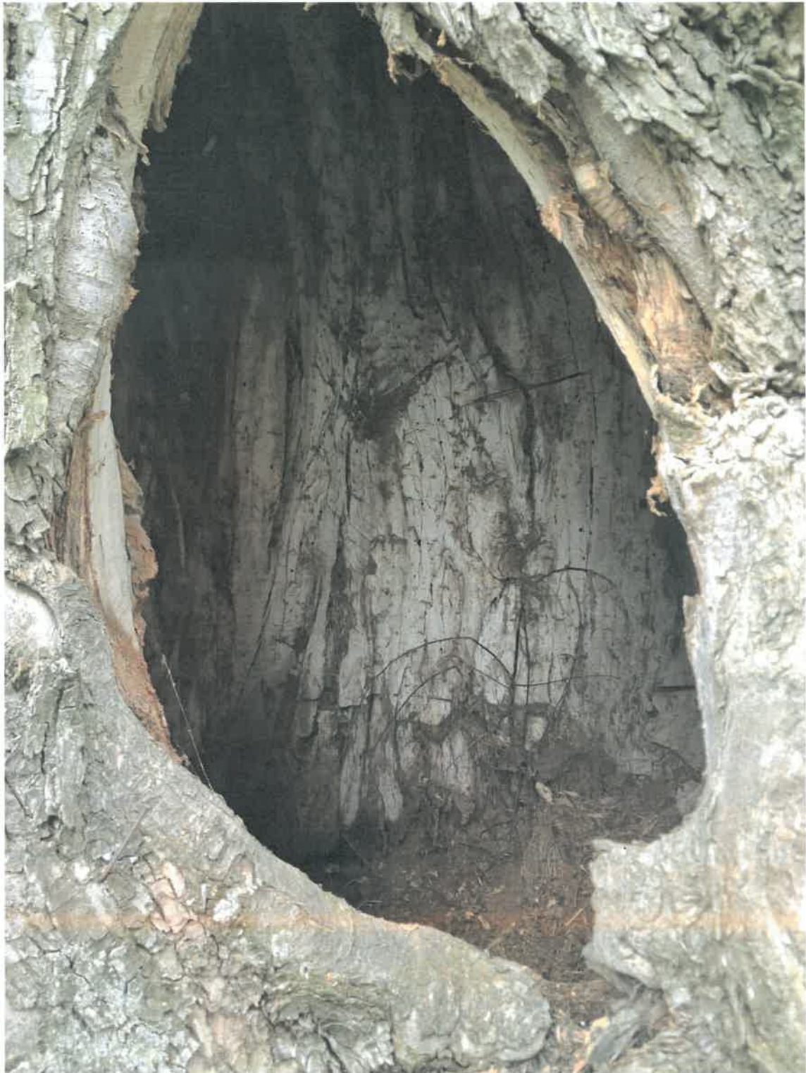
Wiąz szypułkowy - Ulmus laevis o obwodzie pnia 581 cm, znajdujący się na działce oznaczonej numerem ewid. 324/5 w miejscowości Strzałki, obręb geodezyjny Strzałki gm. Burzenin

Załącznik nr 3 do uchwały nr XVIII/112/25 Rady Gminy Burzenin z dnia 25 listopada 2025 r.