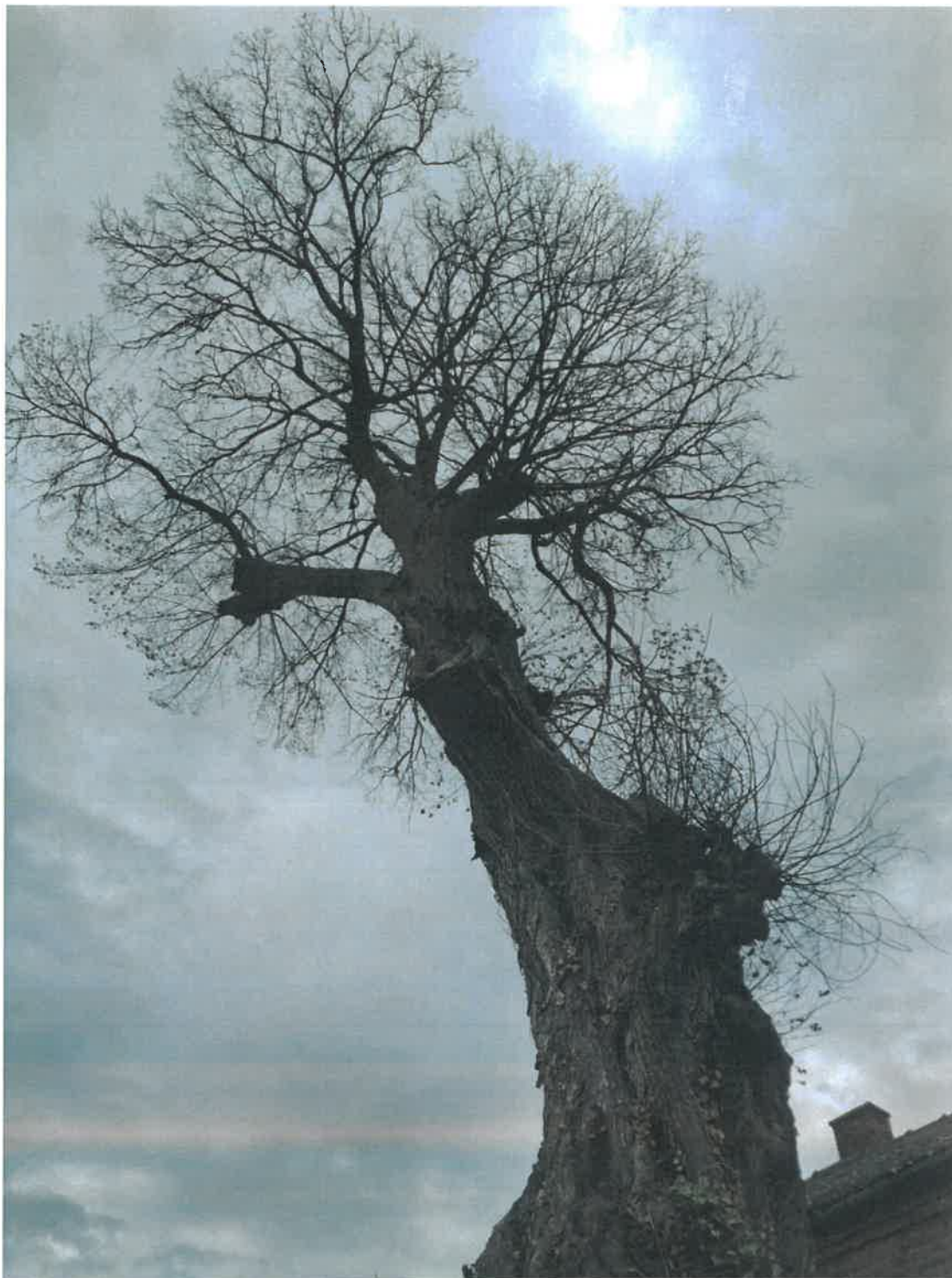
Wiąz szypułkowy - Ulmus laevis o obwodzie pnia 581 cm, znajdujący się na działce oznaczonej numerem ewid. 324/5 w miejscowości Strzałki, obręb geodezyjny Strzałki gm. Burzenin

Załącznik nr 2 do uchwały nr XVIII/112/25 Rady Gminy Burzenin z dnia 25 listopada 2025 r.